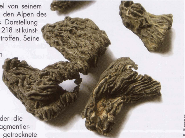
Getrocknete Exemplare von Ptychoverpa bohemica aus unserm Lot

Wir erhielten vom Produzenten, der die Grossverteiler belieferte, sowohl fragmentierte Nasskonserven als auch einige getrocknete Fruchtkörper zur Untersuchung. In allen Proben, inklusive in zwei Pasteten, fanden wir nur Asci mit den erwähnten Riesensporen. Makroskopisch sind die Böhmisches Morcheln leicht zu erkennen an ihren freien Stielen und glockenförmig aufgesetzten Hüten und vor allem an dem längsfaltigen, dicht gedrängten, welligen Hymenium, so wie es auch Bächler (2) an einem zweisporigen Fund aus dem Bedrettal beschreibt.