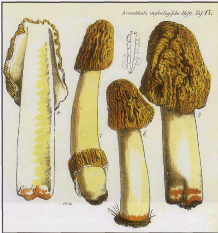
Morchella bohémica , Krombholtz Taf. 17

Wir nahmen zunächst an, es handle sich um einen Irrgast unter einem Lot von Morchella conica . Doch zeigten eine zweite und eine dritte Pastete dasselbe Bild mit den Riesensporen, die immer zu zweien hintereinander aufgereiht waren.