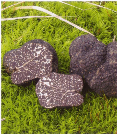
Abb. 3 Tuber brumale Wintertrüffel | Truffe d'hiver

Doch nicht genug damit: Die Entdeckung von China-Trüffeln in einer piemontesischen Kultur von Périgords (2) rief sogar den nationalen italienischen Forschungsrat auf den Plan. Wie konnten die Exoten die Haine unterwandern? Wurden die Setzlinge irrtümlich mit Myzel von Tuber indicum gepimpft? Die nahe Verwandtschaft der beiden