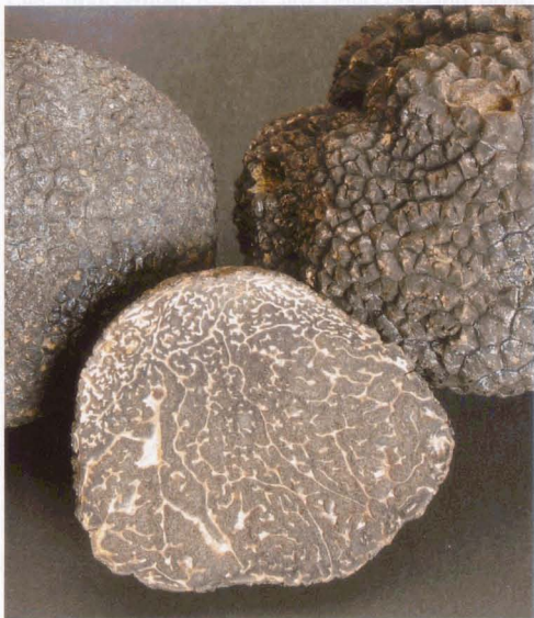
Abb. 4 Tuber melanosporum Périgord-Trüffel