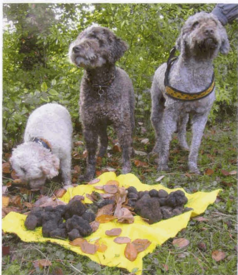
Abb. 1 Lagotto, die typischen Trüffelhunde

Wo hl dem Trüffelbauern der über geeignetes Gelände und ein entbehrliches Startkapital verfügt. Die Pflanzungen mit den beimpften Bäumchen lassen sich gegen 10 Jahre Zeit bis sich die Partnerschaft mit den Trüffeln allmählich zu lohnen beginnt. Und bald plagen den Trüffelbauern neue Sorgen.