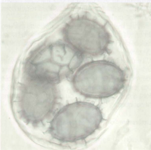
Tuber aestivum : Sporen | Spores

FLAMMER R. & T. FLAMMER 2009. Trüffelanalyse für Lebensmittelexperten. 6., aktualisierte Auflage. Eigenverlag, Schaffhausen.