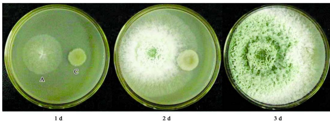
Fig. 1 Trichoderma viride overgrowing Botrytis cinerea ( B. cinerea was inoculated 1 d earlier than T. viride ). A: T. viride ; B: B. cinerea .