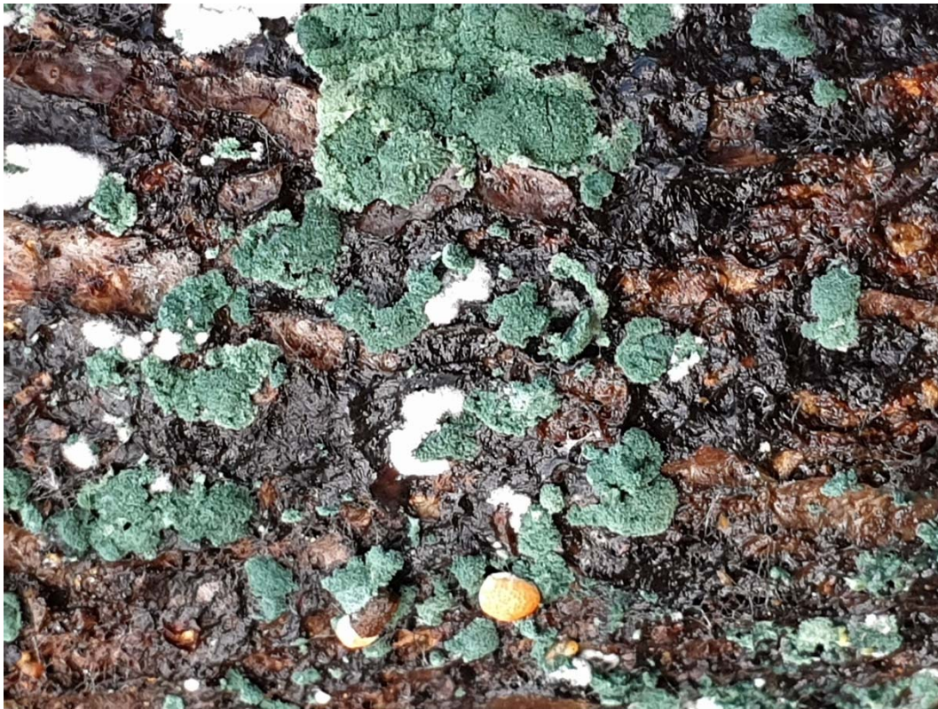
Trichoderma viride

Es lohnt sich etwas mehr über Trichoderma zu wissen, denn viele Mykologen kennen z.B. Trichoderma viride nur als das grüne Sporenlager, das sie oft auf morschen Ästen finden. Sucht man nach « trichoderma viride » im Internet werden 630'000 Treffer angezeigt.