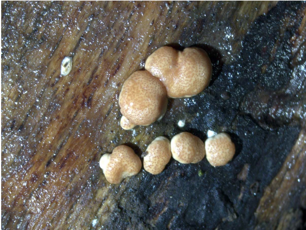
Hypocrea rufa

Die Geschichte begann 1794 als Pearson als erster Trichoderma beschrieb und später andeutete die Verbindung zur sexuellen Form in der Form von Hypocrea entdeckt zu haben.