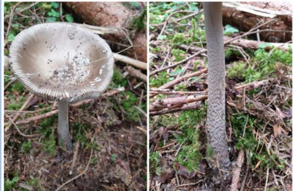
10799 19.09.2020 Dauchingen