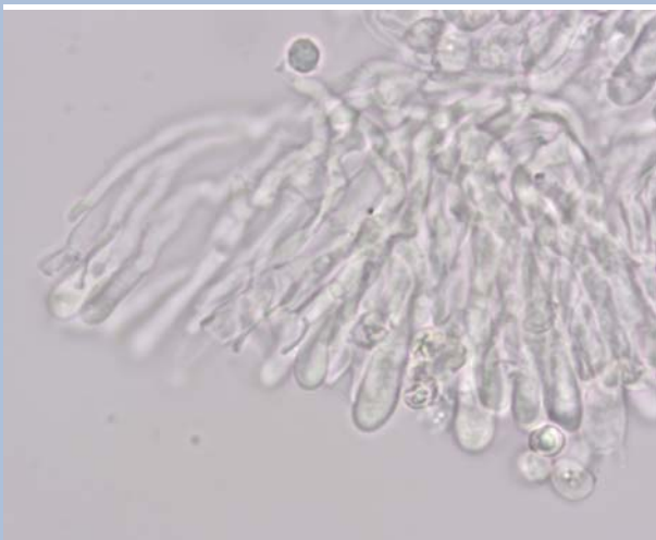
9912 04.09.2019 Kohlfirst