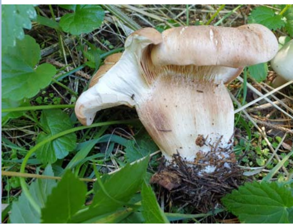
10736 09.09.2020 Wutach