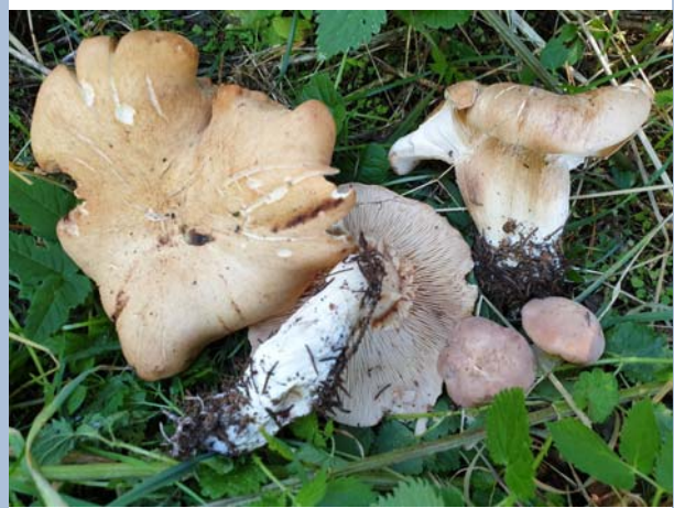
10737 09.09.2020 Wutach