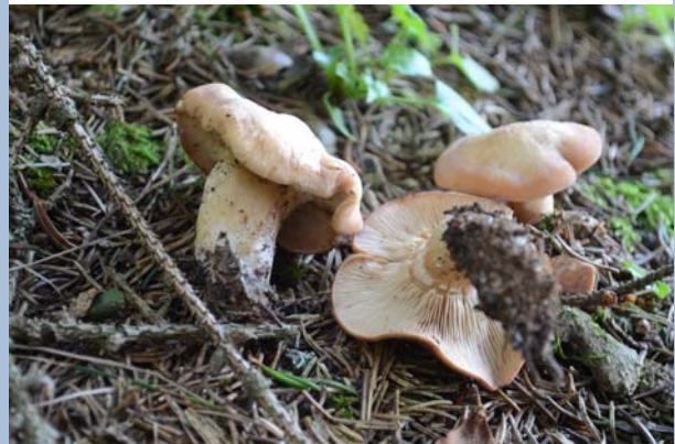
9906 03.09.2023 Kohlfirst