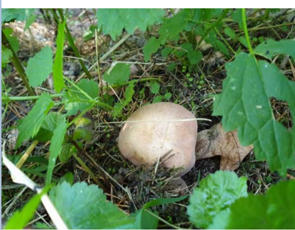
10738 09.09.2020 Wutach

Fungi, Dikarya, Basidiomycota, Agaricomycotina, Agaricomycetes, Agaricomycetidae, Agaricales, Entolomataceae