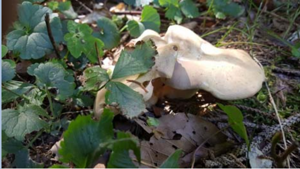
9905 04.09.2019 Kohlfirst

Fungi, Dikarya, Basidiomycota, Agaricomycotina, Agaricomycetes, Agaricomycetidae, Agaricales, Entolomataceae