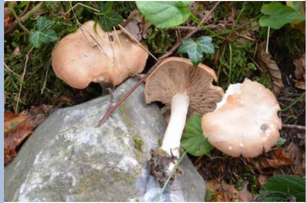
5791 06.09.2015 Gennersbrunn