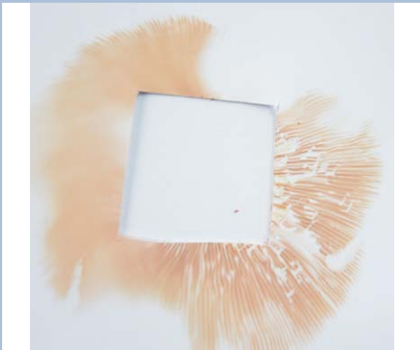
5788 06.09.2015 Gennersbrunn