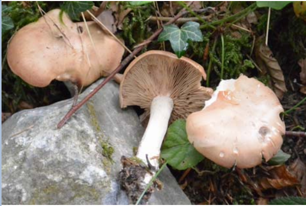
5792 21.09.2022 Gennersbrunn

Fungi, Dikarya, Basidiomycota, Agaricomycotina, Agaricomycetes, Agaricomycetidae, Agaricales, Entolomataceae