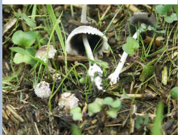
7811 28.04.2018 Wutach