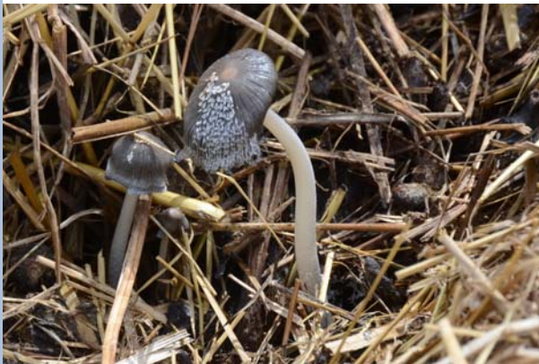
7933 29.05.2018 Elbigenalp