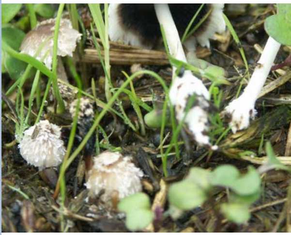
1144 28.04.2018 Wutach