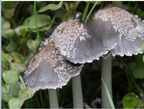
1143 28.09.2009 Wutach

Fungi, Dikarya, Basidiomycota, Agaricomycotina, Agaricomycetes, Agaricomycetidae, Agaricales, Psathyrellaceae