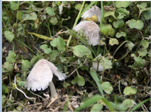
28.09.2009 Wutach