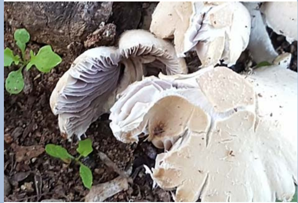
8595 03.12.2018 Malaga