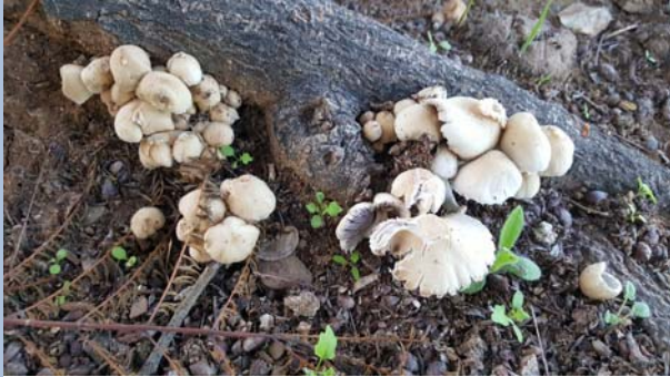
8294 26.10.2018 Malaga

Fungi, Dikarya, Basidiomycota, Agaricomycotina, Agaricomycetes, Agaricomycetidae, Agaricales, Psathyrellaceae