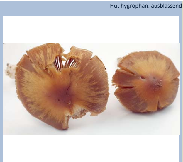
Hut hygrophan, ausblassend