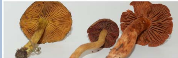
Cortinarius croceus - semisanguines - orellanus zurselben Zeit am selben Standort