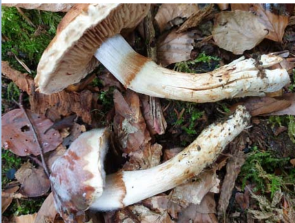
10062 08.10.2022 Gennersbrunn