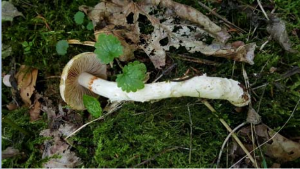
9998 16.09.2019 Wutach

Fungi, Dikarya, Basidiomycota, Agaricomycotina, Agaricomycetes, Agaricomycetidae, Agaricales, Cortinariaceae, Cortinarius