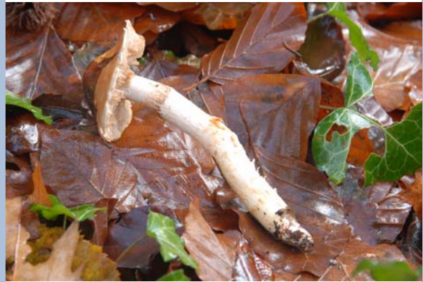
10004 16.09.2019 Güttingerwald