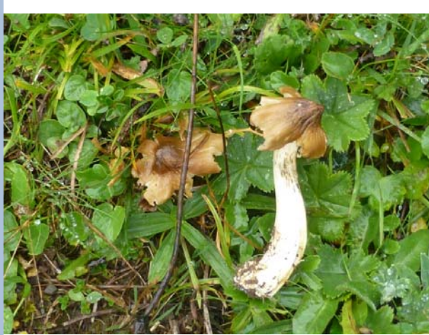
3754 09.09.2013 Ramslauenen (Kiental)

Fungi, Dikarya, Basidiomycota, Agaricomycotina, Agaricomycetes, Agaricomycetidae, Agaricales, Tricholomataceae, Cuphophyllus