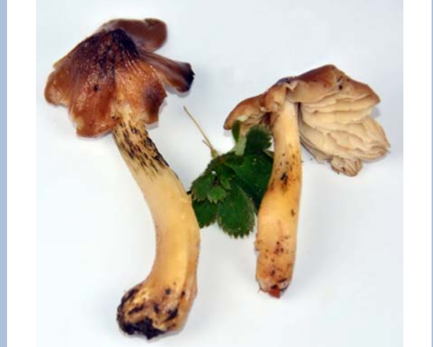
3755 09.09.2013 Ramsen