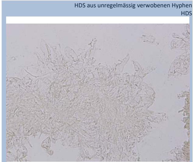
HDS aus unregelmässig verwobenen Hyphen HDS