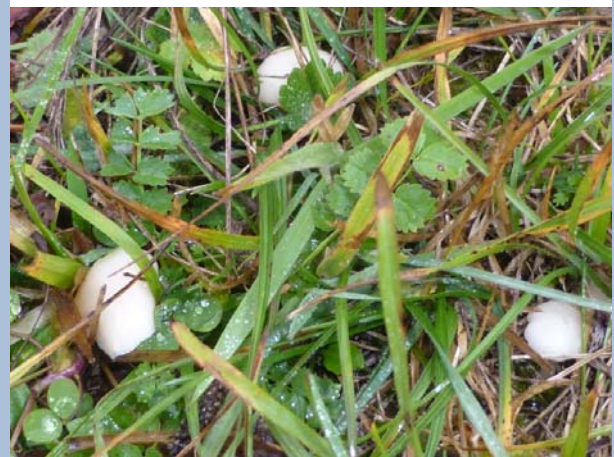
4171 17.11.2013 Dornbirn