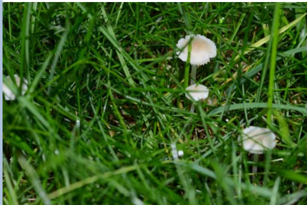
6564 13.11.2016 Pfälzerwald

Fungi, Dikarya, Basidiomycota, Agaricomycotina, Agaricomycetes, Agaricomycetidae, Agaricales, Tricholomataceae, Cuphophyllus