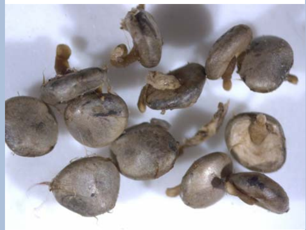
Sporenpakete mit Myzelstrang (Funiculus)