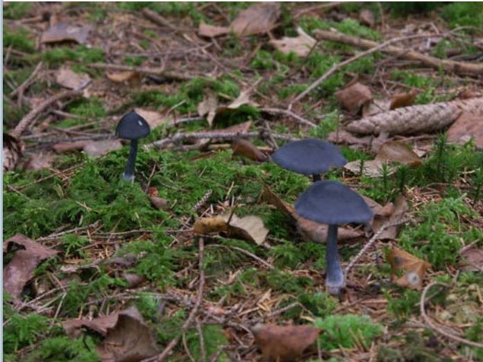
596 28.09.2009 Hirschberg Starkenmühle