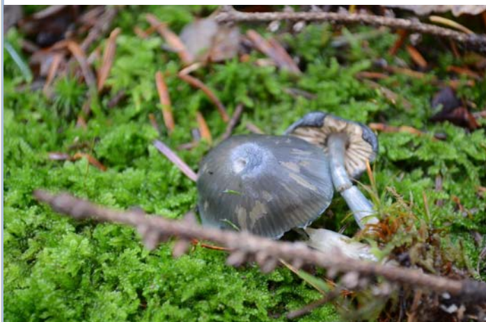
Flammer, T© Hirschberg Starkenmühle