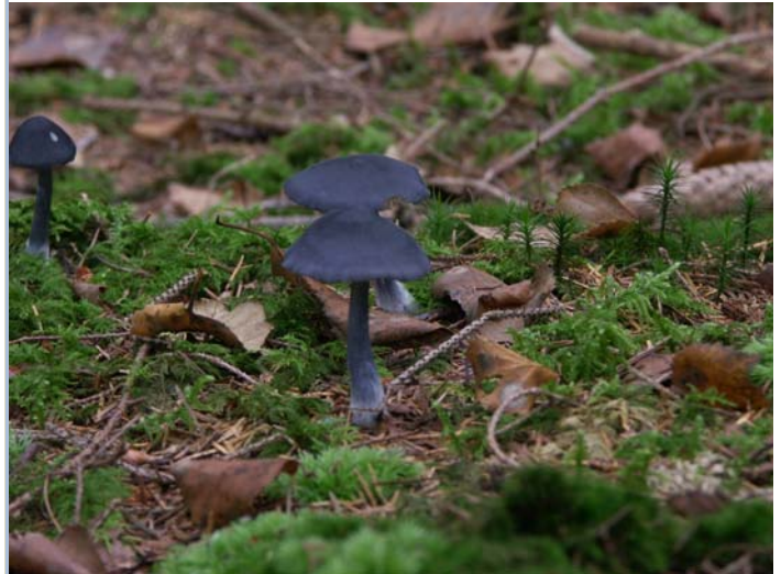
816 28.09.2009 Hirschberg Starkenmühle