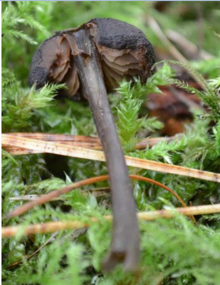
6934 27.09.2017 Solenberg