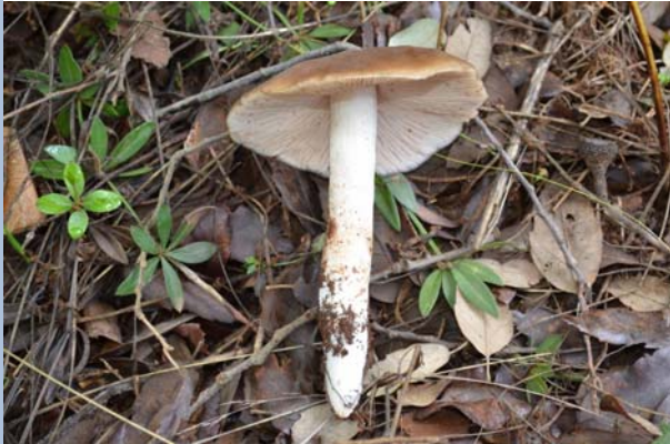
5887 18.10.2015 Arazena Alto de El Chorrito

Fungi, Dikarya, Basidiomycota, Agaricomycotina, Agaricomycetes, Agaricomycetidae, Agaricales, Entolomataceae