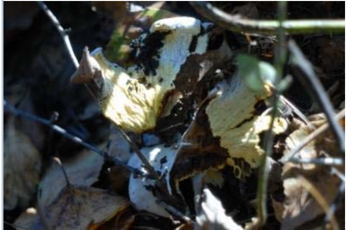
Goldschimmel auf Paxillus involutus