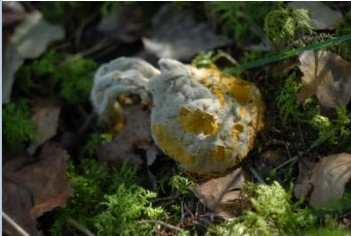
Goldschimmel auf Röhrling