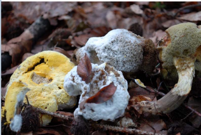
Hyphomyces auf Xerocomus chrysenteron