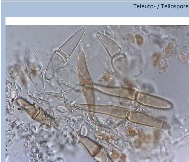
Teleuto- / Teliosporen