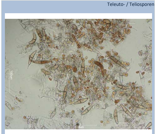
Teleuto- / Teliosporen