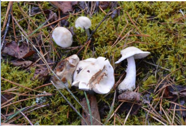
5815 25.09.2015 Wutach

Fungi, Dikarya, Basidiomycota, Agaricomycotina, Agaricomycetes, Agaricomycetidae, Agaricales, Strophariaceae