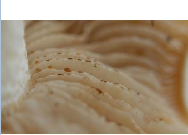
Lamellen mit feinen Guttinationströpfchen

Fungi, Dikarya, Basidiomycota, Agaricomycotina, Agaricomycetes, Agaricomycetidae, Agaricales, Strophariaceae