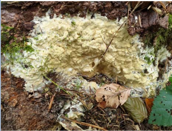
4095 14.09.2022 Etzwilen

Fungi, Dikarya, Ascomycota, Pezizomycotina, Sordariomycetes, Hypocreomycetidae, Hypocreales, Hypocreaceae