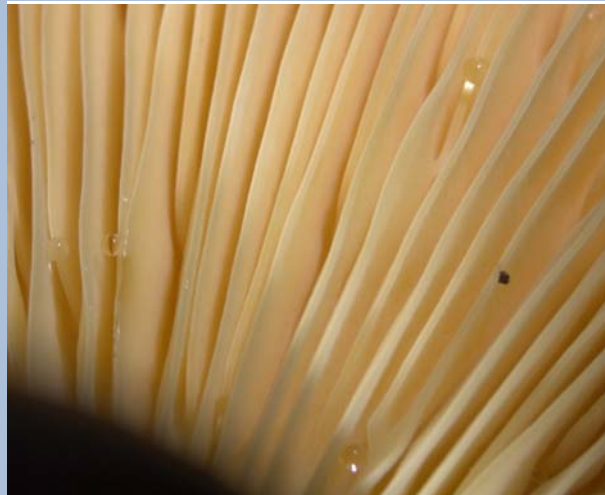
Lamellen mit Guttinationströpfchen Lamellen