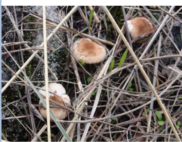
2509 27.12.2011 Arazena

Fungi, Dikarya, Basidiomycota, Agaricomycotina, Agaricomycetes, Agaricomycetidae, Agaricales, Agaricaceae