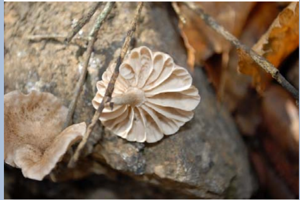
2426 12.11.2011 Arazena

mit intrazellulärem Pigment Cheilozystiden