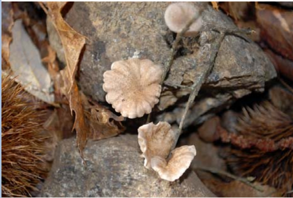
2427 12.11.2011 Arazena

Fungi, Dikarya, Basidiomycota, Agaricomycotina, Agaricomycetes, Agaricomycetidae, Agaricales, Omphalotaceae