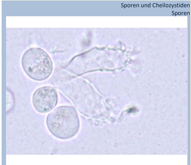
Sporen und Cheilocystiden Sporen