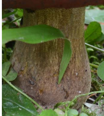
6751 31.07.2017 Schwarzwald Rothaus