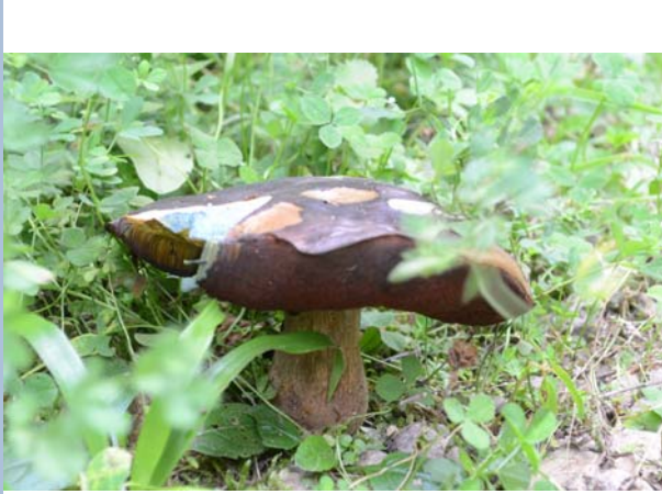
6750 31.07.2017 Schwarzwald Rothaus