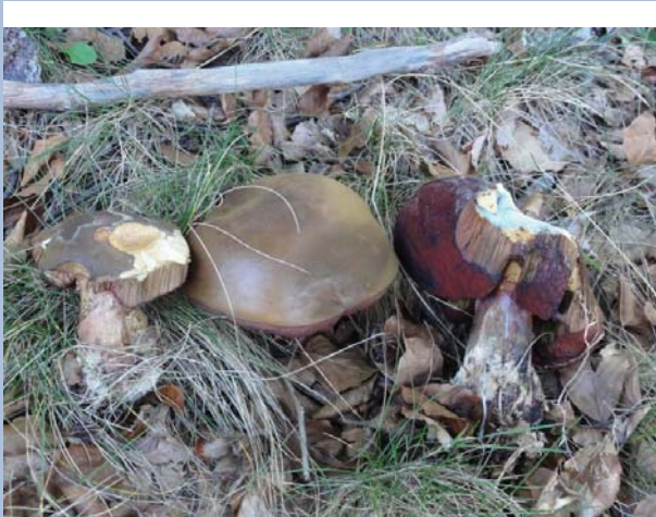
3300 27.10.2012 Trecchina