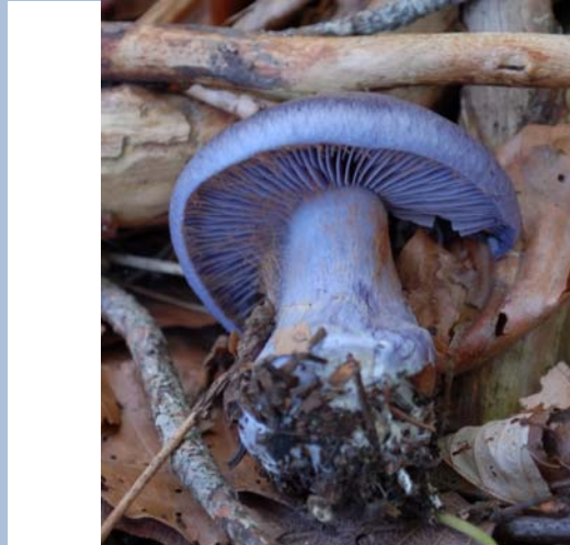
1848 19.09.2010 Wutach

Fungi, Dikarya, Basidiomycota, Agaricomycotina, Agaricomycetes, Agaricomycetidae, Agaricales, Cortinariaceae, Phlegmacium