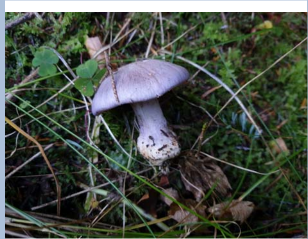
11615 10.11.2020 Hirschberg