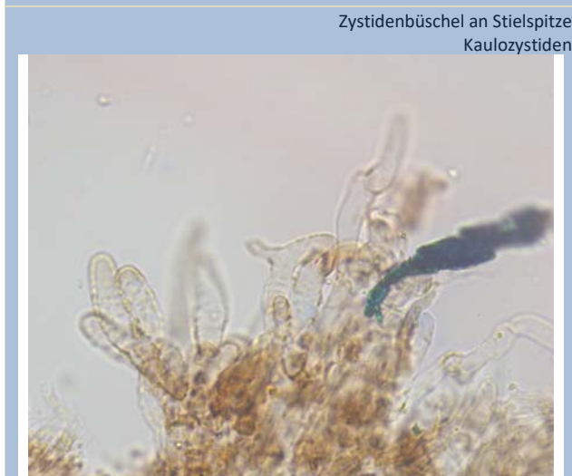
Zystidenbüschel an Stielspitze Kaulozystiden