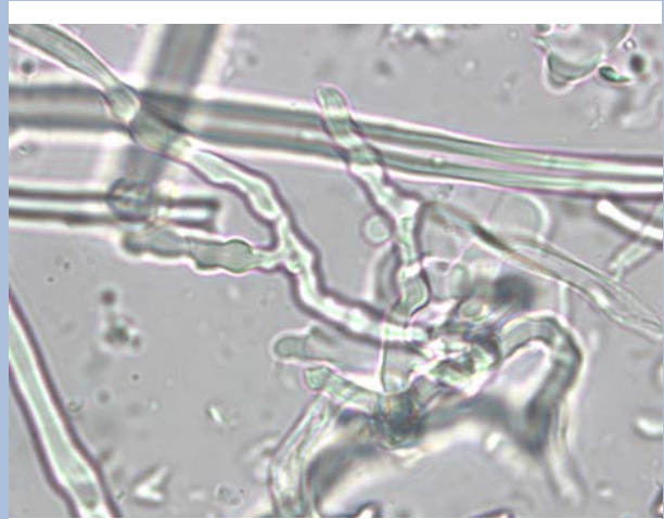
Bindehyphen im Trama