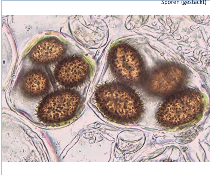
reife und unreife Sporen (gestackt)