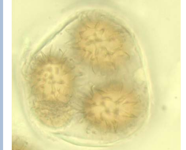
Ascus/Asci mit Sporen